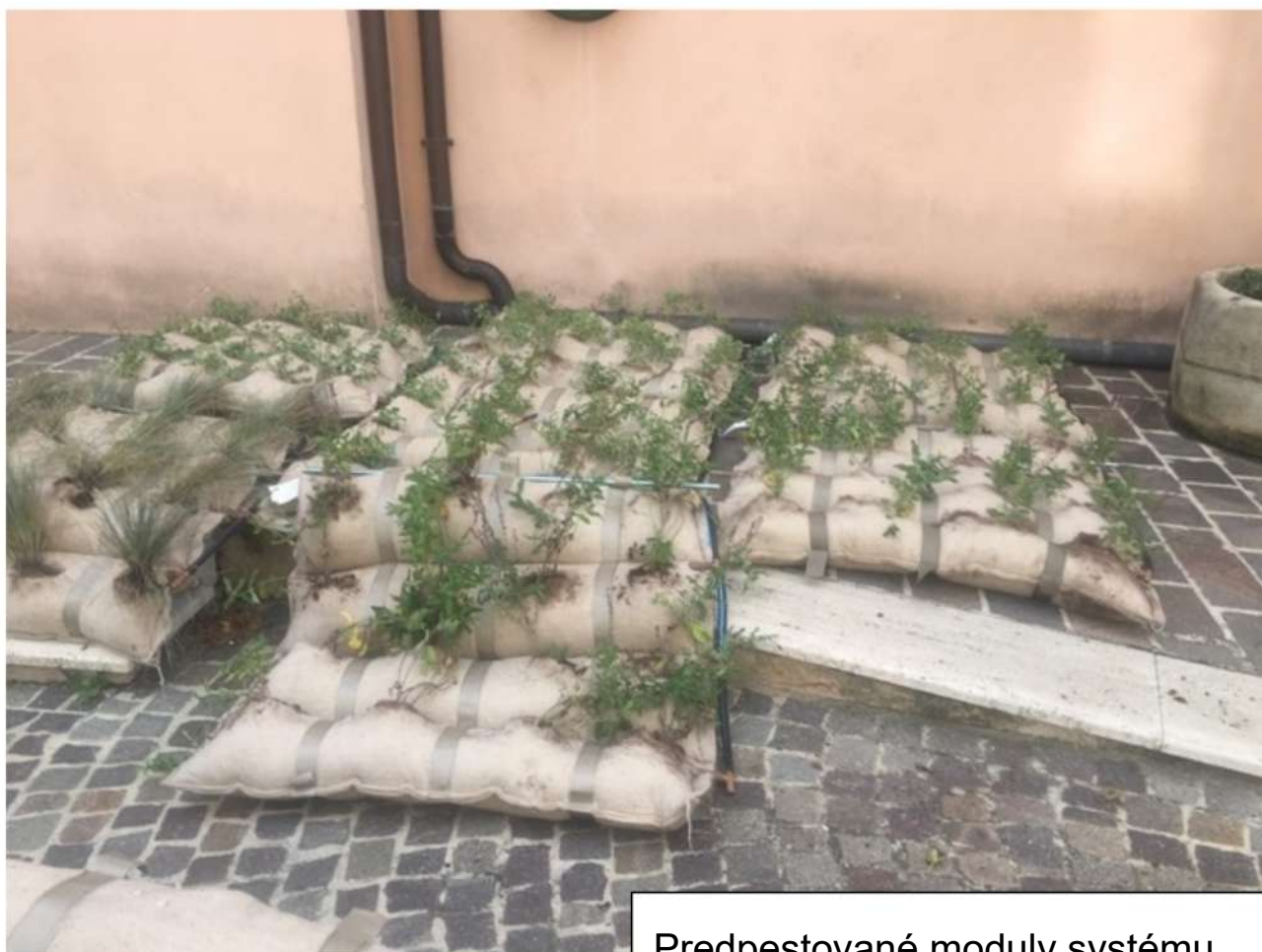
Predpestované moduly systému Viridis® s predinštalovanou závlahou a pripravené pre montáž.